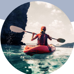
Freiheit und Verantwortung