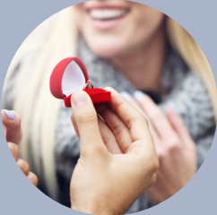
Liebe und Ehe